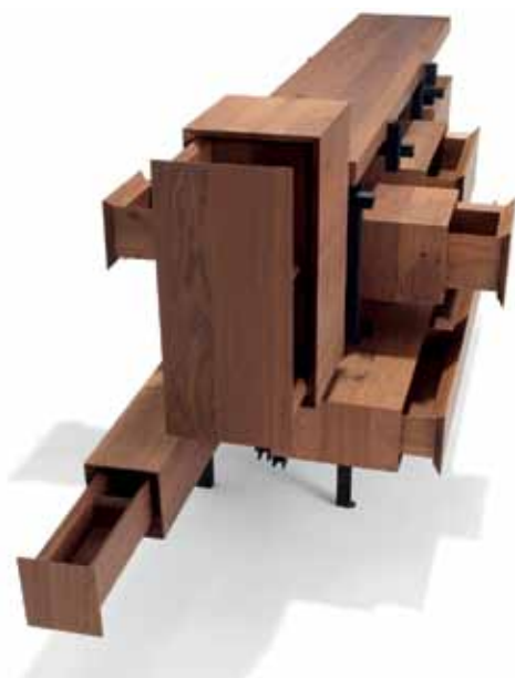
Roderick Vos: 'Montigny Château de la Resle', 2013. Te zien bij Priveekollektie Contemporary Art/Design (Heusden aan de Maas), op Design Miami/Basel.

Amy Yao: 'Fan no. 4, Changing boy-friends like I'm changing shoes', 2013. Gemengde techniek. Te zien bij VI, VII (Oslo), op Liste.