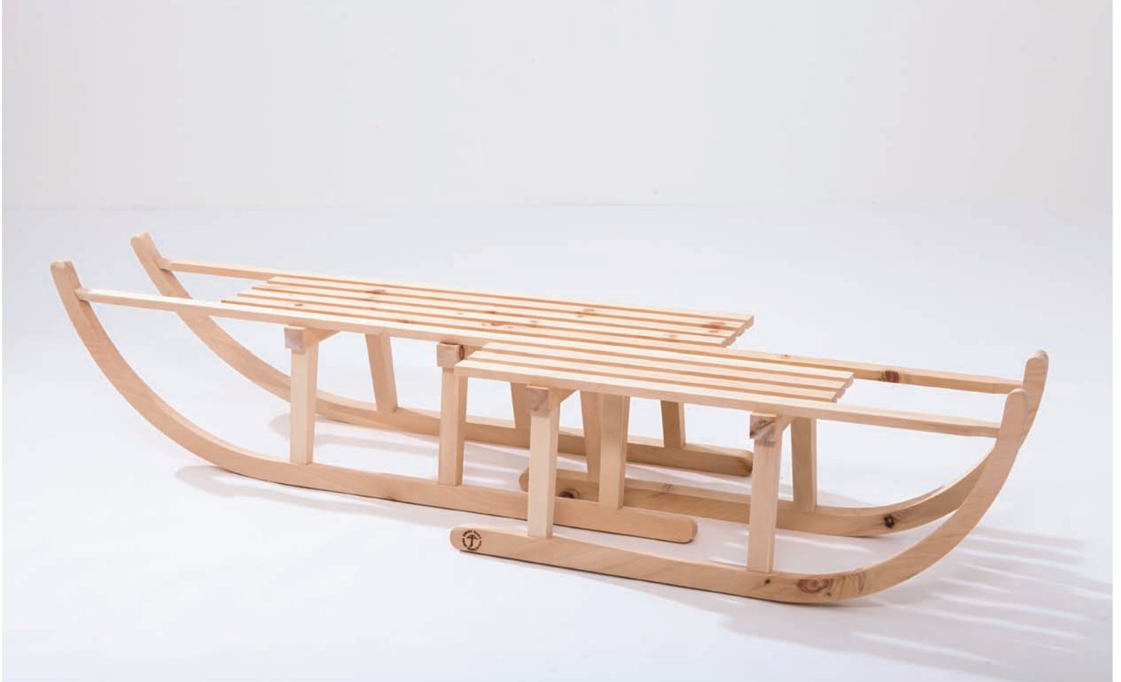
Rolf Sachs, Schlitten-Couchtisch insepar-able , Schweizer Steinpinie.